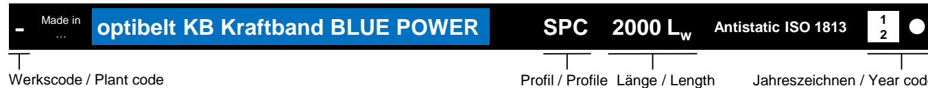
Prinzip-Skizze Principle sketch

Kennzeichnungsbeispiel / Marking example: